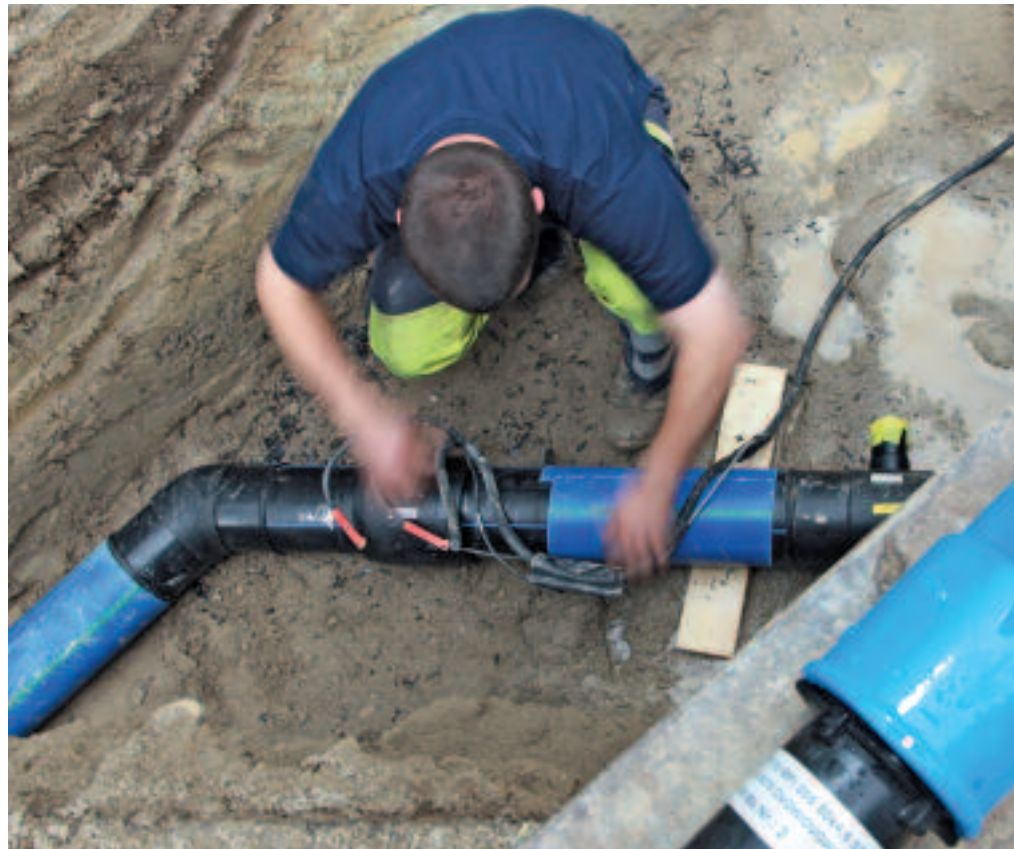
Die Trinkwasserversorgung in Stäfa hat erste Priorität: Erneuerung der Netzleitung.